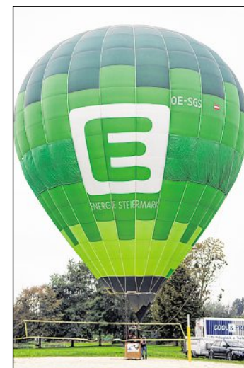
Das Team der Energie Steiermark will beim Parktherme Radmarathon Wildon wieder ganz hoch hinaus.