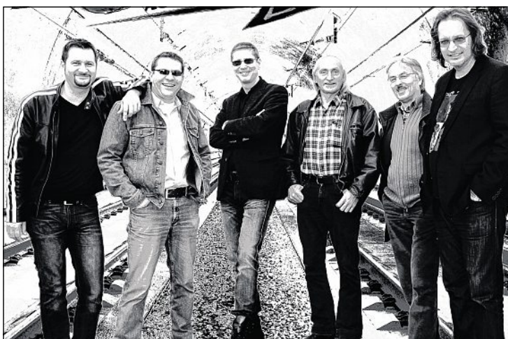
Blues-Rock-Funk zu Gast: Am 17. Juli um 19.30 Uhr gastiert die Band Crossfire in der Porubsky-Halle in Leoben. Die Sechs-Mann-Formation unterhält ihr Publikum mit Songs von Jimi Hendrix, Stevie Ray Vaughan oder auch von AC/DC oder ZZ-Top. Karten im Zentralkartenbüro.